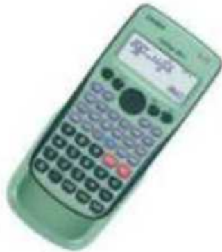
Une calculatrice scientifique

A chaque séance de SNT, on se présente avec :