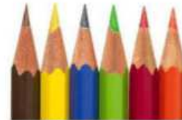
Crayons de couleur (5 ou 6 minimum) et un taille-crayon