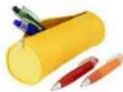
Trousse avec stylo bille, etc.