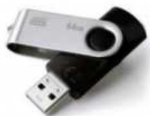
Une clé USB (facultatif)